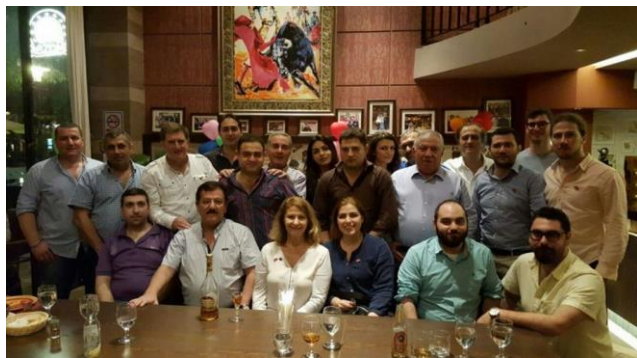
Չինաստանի Չայկական համայնքը Գուանգչոում