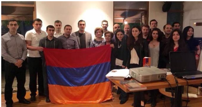
Չինաստանի Չայկական համայնքը ծանհայում

ՉԻՆԱՍՏԱՆԻ ԶԱՅԿԱԿԱՆ ԶԱՄԱՅՆՔԸ ՑԵՂԱՍՊԱՆՈՒԹԱՆ 101-րդ ՏԱՐԵԼԻՑԻՆ ՆԿԻՐԿԱԾ ՄԻՋՈՑԱՌՈՒՄՆԵՐ ԱՆՑԿԱՑՐԵՑ ՉԻՆԱՍՏԱՆԻ ՄԻ ԾԱՐՔ ՔԱՂԱՔՆԵՐՈՒՄ