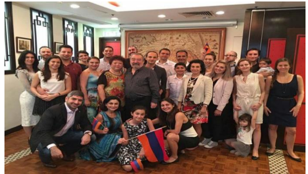
Չինաստանի Չայկական համայնքը Յոնկոնգում