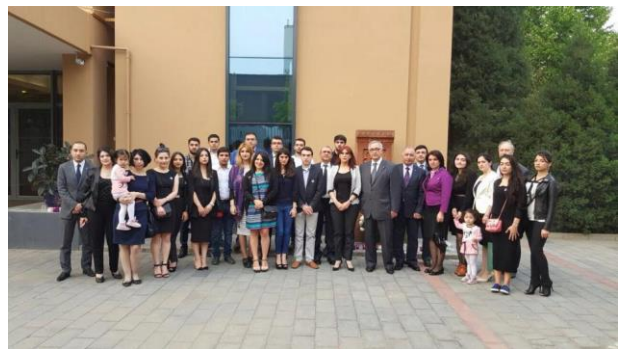
Չինաստանում ՀՀ դեսպանատուն

Չինաստանի Չայկական համայնքը Հայոց ցեղասպանության հիշատակմանը նվիրված ամենամյա միջոցառում է անցկացնում: Ամեն տարի, ապրիլի 24-ին Չինաստանի տարբեր նահանգներում հայերը հավաքվում են հարգելու անմեղ զոհերի հիշատակը և փաստելու, որ հայն իր հարուստ մշակութային ժառանգությամբ շարունակելու է ապրել և երբեք չի մոռանալու այն, ինչ պատահեց: Այս տարի հավաքներ տեղի ունեցան ծանհայում, Պեկինում, Յոնկոնգում և Գուանգչոում: